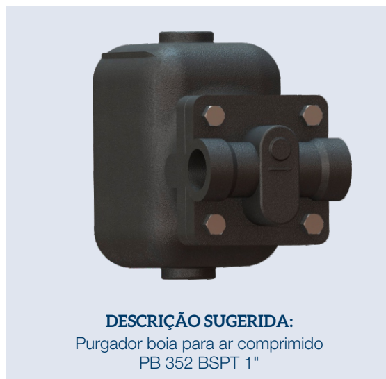
DESCRIÇÃO SUGERIDA: Purgador boia para ar comprimido PB 352 BSPT 1"